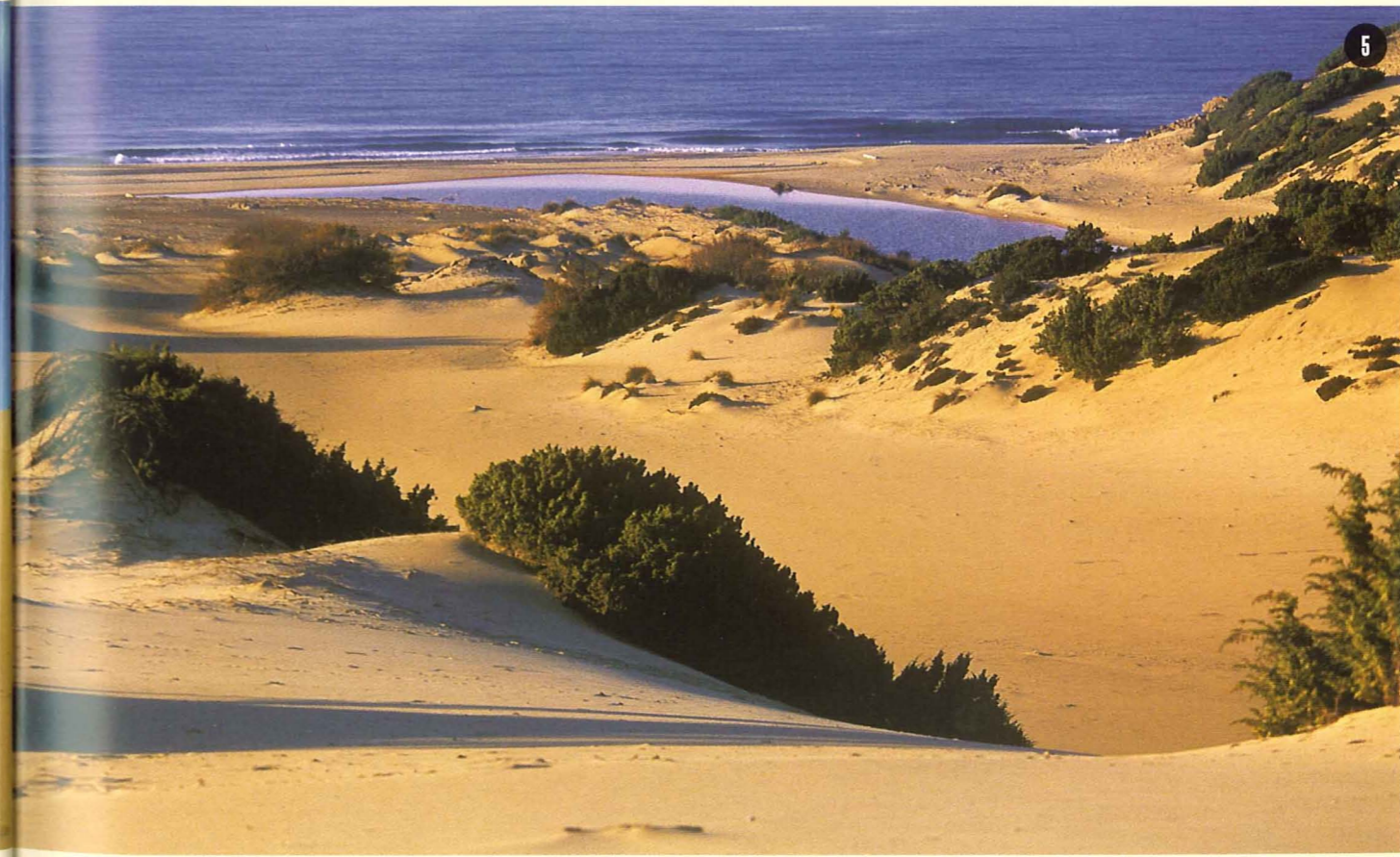
2) - Torre dei Corsari, La casa del Poeta 3/5) - Dune di Piscinas 4) - Costa Verde (Arbus)