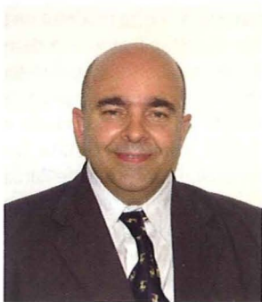
Fabrizio Collu, assessore alla Protezione civile della Provincia del Medio Campidano