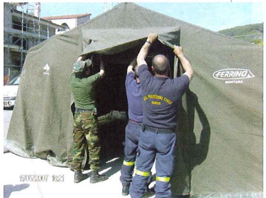
Allestimento campo base

● le postazioni COM: realizzate all'interno della sala operativa provinciale, sono gli spazi attrezzati (collegamenti radio, fax, telefono, computer, cartografia ecc.) della Sala operativa destinati alle varie forze e organismi di protezione civile che in caso di emergenza e necessità costituiscono il COM (Post. 1 - Radio localizzazione, Post. 2 - Comuni, Post. 3 - Prefettura UTG; Post. 4 - Corpo Forestale, Post. 5 - Forze dell'ordine, Post. 6 - Provincia Medio Campidano, Post. 7 - Associazioni