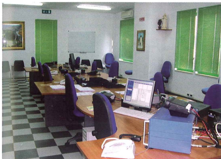
Sala operativa provinciale

condizioni di vita nelle aree colpite da eventi calamitosi;