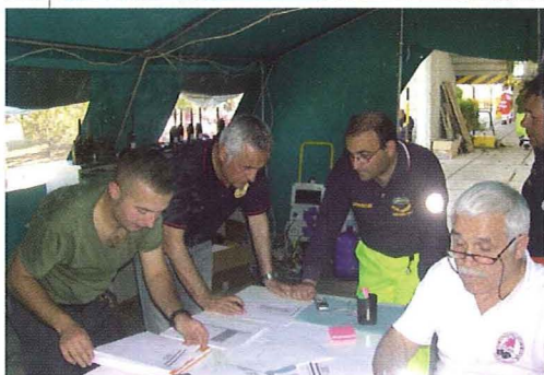
Esercitazione di protezione civile