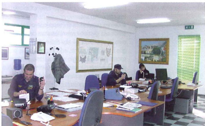
Sala operativa in funzione