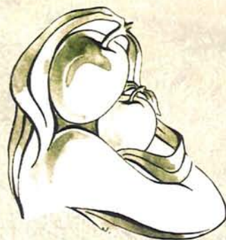
Disegno in copertina di Ester Garau